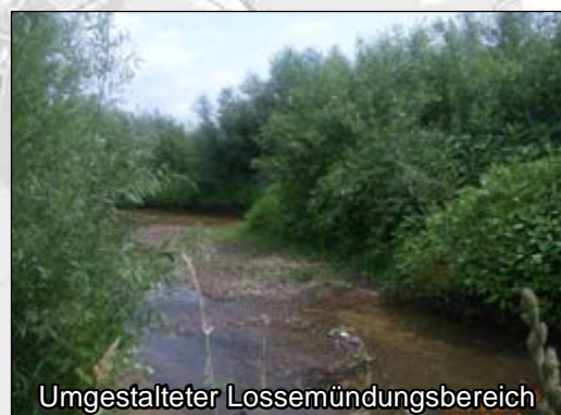
Naturnahe Umgestaltung der Lossemündung in der Fuldaaue von Kassel-Unterneustadt Maßn.-Typ 2, 3, 6, 7, 8, 9, 10, 11