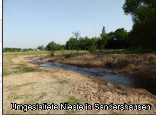
Naturnahe Umgestaltung der Nieste in Sandershausen Maßn.-Typ 2, 3, 5, 6, 8, 9, 10