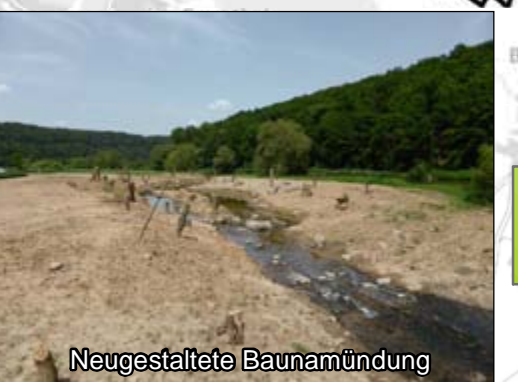
Naturnahe Umgestaltung der Bauna bei Guntershsn. Maßn.-Typ 2, 3, 5, 8, 9, 10