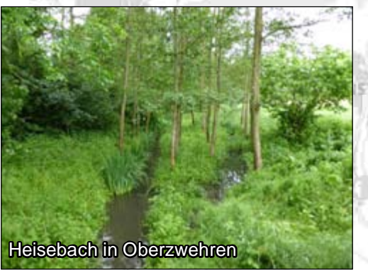
Heisebach Maßn.-Typ 2, 3