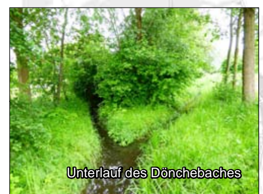
Dönchebach Maßn.-Typ 2, 3