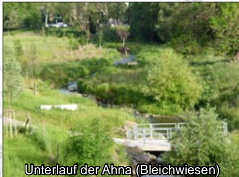
Umgesetzte Maßnahmen an der Ahna: Maßn.-Typ 1, 2, 3, 4