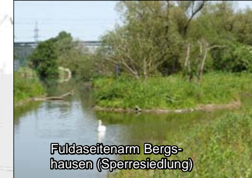
Fulda in Bergshausen (an der Sperrbesiedlung) Maßn.-Typ 3, 7, 8